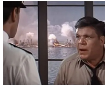
1970 TORA! TORA! TORA! (Tora! Tora! Tora!) de Richard Fleischer et Kinji Fukasaku