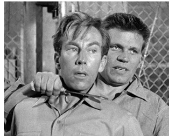
1954 LES RÉVOLTÉS DE LA CELLULE 11 (Riot in Cell Block 11) de Don Siegel avec Whit Bissell