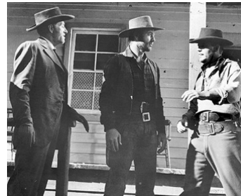
1954 LES BRIGANDS DE L'ARIZONA (The Lone Gun) de Ray Nazarro avec G. Montgomery