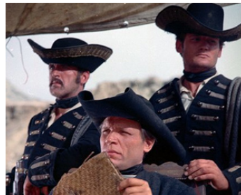
1962 L'ÎLE DE LA VIOLENCE (Hero's Island) de Leslie Stevens avec William Hart