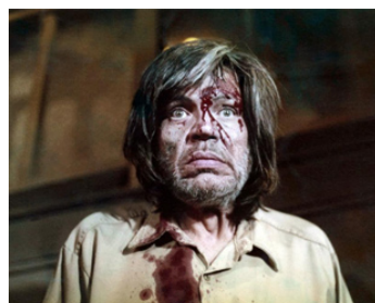
1977 LE CROCODILE DE LA MORT (Eaten Alive) de Tobe Hopper