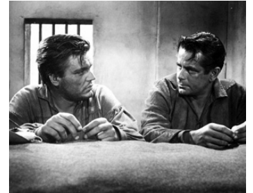
1953 LE DÉSERTEUR DE FORT ALAMO (The Man from the Alamo) de B. Boetticher avec Glenn Ford