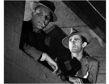
1952 LE CRAN D'ARRÊT (The Turning Point) de William Dieterle avec Ted de Corsia