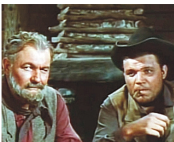
1956 LA PROIE DES HOMMES (Raw Edge) de John Sherwood avec Emile Meyer