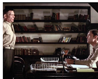
1980 LA CONSTELLATION DES DAMNÉS (The 9th Configuration) de W. P. Blatty avec Stacy Keach