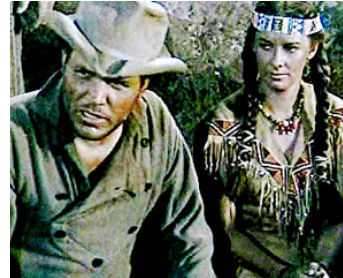
1953 LA CHARGE SUR LA RIVIÈRE ROUGE de Gordon Douglas avec Vera Miles