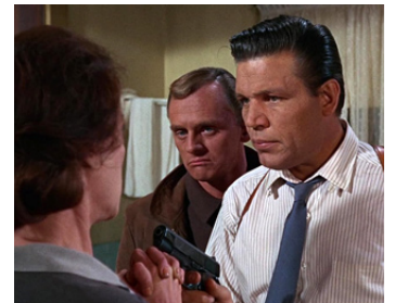
1965 L'ESPION AUX PATTES DE VELOURS (That Darn Cat!) de R. Stevenson avec Frank Gorshin