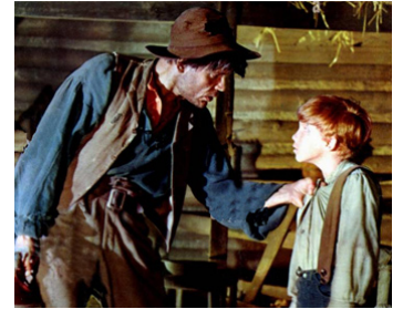
1960 LES AVENTURIERS DU FLEUVE (The Adv. of Huckleberry Finn) de M. Curtiz avec Eddie Hodges