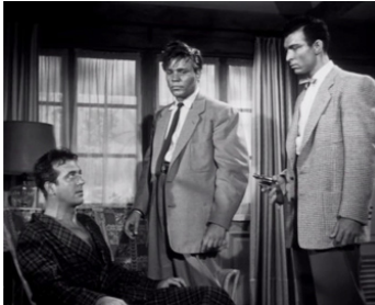
1952 LE 4 e HOMME (Kansas City Confidential) de Phil Karlson avec J. Payne, Lee Van Cleef