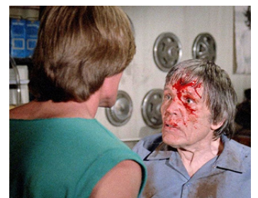
1985 DEMON'S NIGHT (Evils of the Night) de Mardi Rustam avec David Hawk