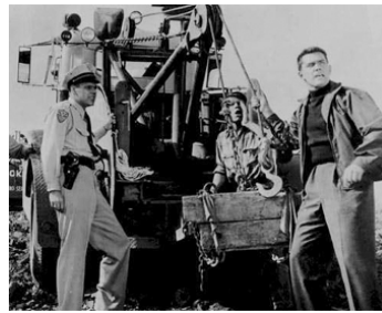
1957 LE CHEMIN DE L'OR (The Way to the Gold) de Robert D. Webb avec Jeffrey Hunter