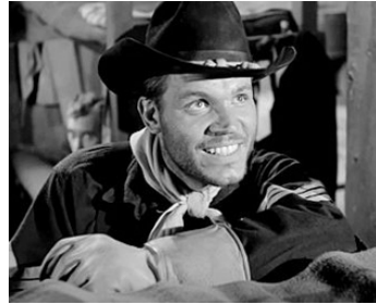
1951 FORT INVINCIBLE (Only the Valiant) de Gordon Douglas