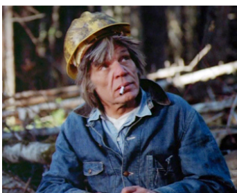
1977 HORIZONS EN FLAMMES (Fire !) d'Earl Bellamy