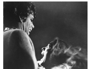
1975 LE TUEUR DÉMONIAQUE (Psychic Killer) de Ray Danton avec Julie Adams