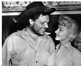
1955 LES CAVALIERS DU DIABLE (The Return of Jack Slade) d'H. Schuster avec Mari Blanchard