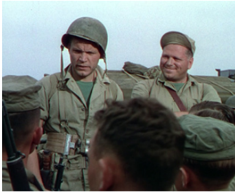
1950 OKINAWA (Halls of Montezuma) de Lewis Milestone avec Bert Freed