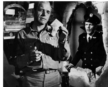
1962 LE PRISONNIER D'ALCATRAZ (Birdman of Alcatraz) de J. Frankenheimer avec B. Lancaster