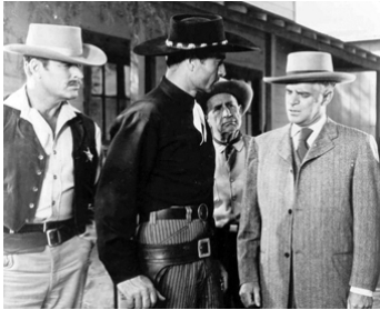
1958 LE PAYS DES SANS-LOI (Badman's Country) de Fred F. Sears avec George Montgomery