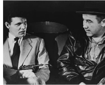
1951 DANS LA GUEULE DU LOUP (The Mob) de Robert Parrish avec Broderick Crawford