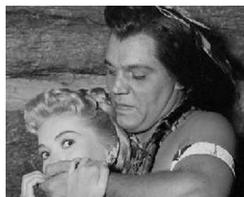
1956 L'ATTAQUE DU FORT DOUGLAS (Mohawk) de Kurt Neumann avec Lori Nelson