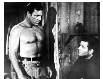
1956 GUN BROTHERS de Sidney Salkow avec Buster Crabbe