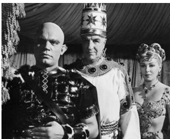
1955 LE FILS PRODIGE (The Prodigal) de Richard Thorpe avec Louis Calhern, Lana Turner