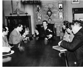
1959 LE TUEUR DE CHICAGO (The Scarface Mob) de Phil Karlson avec Bruce Gordon