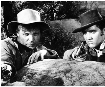
1956 LE CAVALIER DU CRÉPUSCULE (Love me Tender) de Robert D. Webb avec Elvis Presley