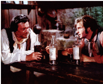
1969 LA HAINE DES DESPERADOS (The Desperados) d'H. Levin avec Vince Edwards