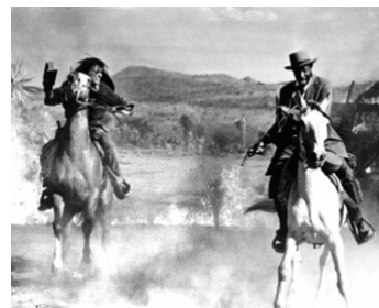
1973 LE SHÉRIF NE PARDONNE PAS (The deadly Trackers) de Barry Shear avec Paul Benjamin