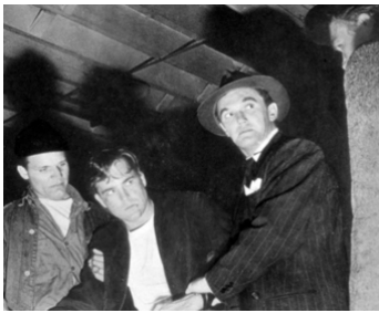
1949 LA BRIGADE DES STUPÉFIANTS (Port of New York) de L. Benedek avec Scott Brady