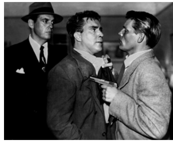
1950 MORT À L'ARRIVÉE (D.O.A.) de Rudolph Maté avec Michael Ross, Edmond O'Brien