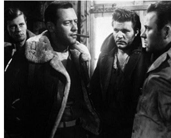
1953 STALAG 17 (Stalag 17) de Billy Wilder avec P. Graves, W. Holden, Richard Erdman