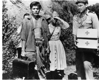
1959 L'ENFER DU VIÊT NAM (Five Gates to Hell) de James Clavell avec Dorothy Michaels