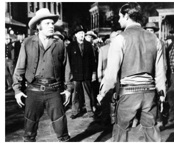
1957 DU SANG DANS LE DÉSERT (The Tin Star) d'Anthony Mann avec Anthony Perkins