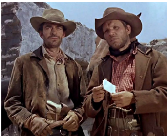
1961 EL PERDIDO (El Perdido) de Robert Aldrich avec Jack Elam