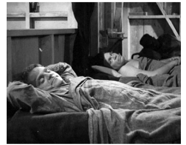
1950 LE FAUVE EN LIBERTÉ (Kiss Tomorrow Goodbye) de Gordon Douglas avec J. Cagney