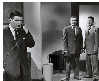
1955 BOBBY WARE IS MISSING de Thomas Carr avec Arthur Franz, Richard Crane