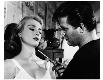
1958 CRI DE TERREUR (Cry Terror) d'Andrew L. Stone avec Inger Stevens