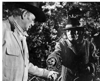
1973 LES CORDES DE LA POTENCE (Cahill U.S. Marshal) d'A. McLaglen avec John Wayne