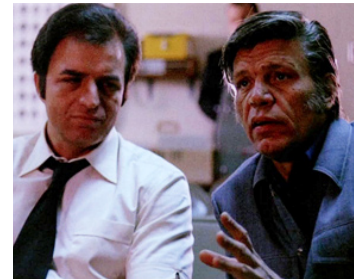
1973 LE DÉTRAQUÉ (The Mad Bomber) de Bert I. Gordon avec Vince Edwards